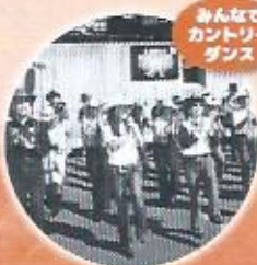
みんなで カントリー ダンス