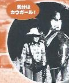
気分は カウガール!